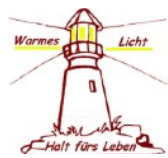
LEUCHTTURM ZEITZ 03441/685458